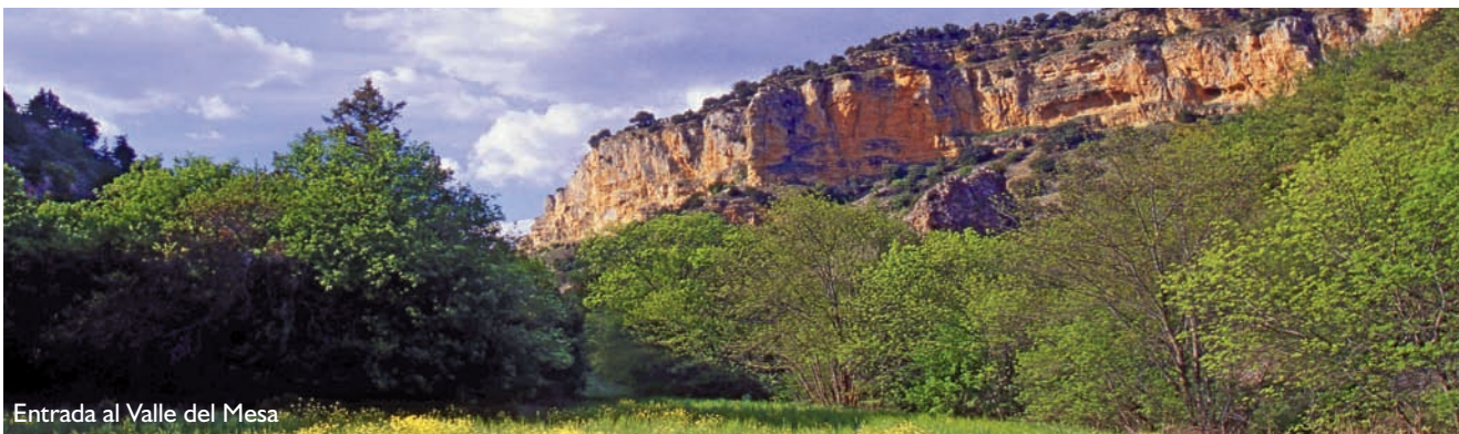
Entrada al Valle del Mesa

El paisaje de hoces, representado en la bella Hoz del río Mesa labrada sobre terrenos secundarios y terciarios, con numerosos escarpes y presencia abundante de gleras en las laderas, con las comunidades florísticas asociadas a este medio. Es un ambiente típico de cantiles calizos con grandes contrastes entre umbría y solana y un espectacular desarrollo de las comunidades de fauna y flora rupícola.