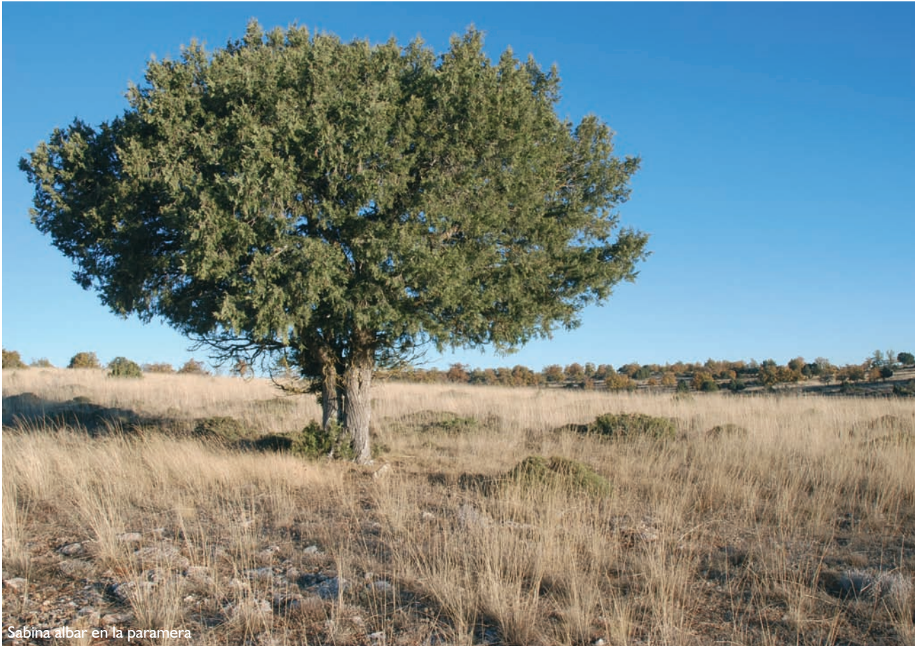
Sabina albar en la paramera

La sierra de Aragoncillo (1.518 m), elevación del zócalo paleozoico que da lugar a una sierra aislada de litología silíceo, formada por cuarcitas y pizarras paleozoicas y areniscas triásicas, que soporta una vegetación silicícola característica de rebollares ( Quercus pyrenaica ) y jarales ( Cistus ladanifer ).