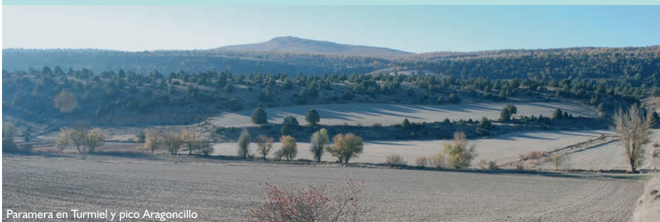
Paramera en Turmiel y pico Aragoncillo

Época aconsejada de visita y otras recomendaciones: primavera y verano. Buen acceso e infraestructura para la visita en Maranchón.